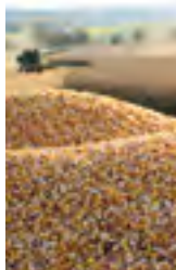
Moderner Pflanzenschutz ist Teil einer leistungsfähigen und ertragreichen Landwirtschaft.

gen der Kunden in den einzelnen Ländern ab. Angestrebt werden höchster Wirkungsgrad bei punktgenauer Anwendung und Umweltfreundlichkeit. Darüber hinaus arbeiten wir indikationsübergreifend in neuen zukunftsweisenden Forschungsprojekten, beispielsweise auf den Gebieten Pflanzengesundheit und Stresstoleranz. Hierbei stehen uns zusätzlich zur klassischen Chemie, Biologie und Biochemie moderne Technologien wie Genomik, Hochdurchsatz-Screening und Bioinformatik zur Verfügung. Damit können wir neue chemische Leitstrukturen identifizieren. Die Wirkstoffpipeline von Crop Protection enthält derzeit 13 Entwicklungsprojekte.